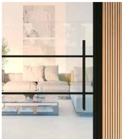
Bargreep (750 mm)