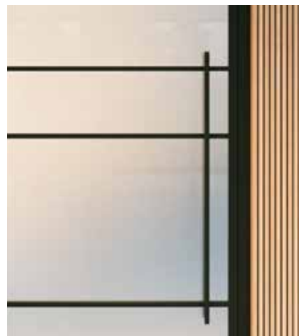
Bargreep (1200 mm)